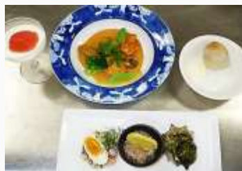
※過去のメニューから

対象：成人 定員：16名（先着順） 費用：3500円 申込：1/12～ 費用を添えて直接施設へ